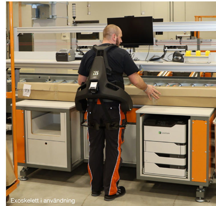
Exoskelett i användning

Inom produktion och logistik satsar vi på genomtänkta åtgärder som antirötthetsmattor för ergonomi och komfort vid stående arbete, otoplastik för optimalt bullerskydd, pneumatiska vakuumlifftar och exoskelett för att reducera kroppsliga belastningar samt individuella fotmätningar för att skyddsskorna ska sitta perfekt.