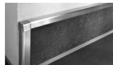
Schlüter®-RONDEC, -JOLLY i -QUADEC profile do wykończenia i ochrony krawędzi ściennych okładzin ceramicznych.