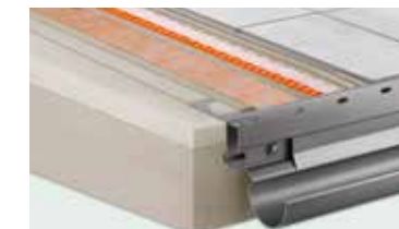
Systemy balkonowe firmy Schlüter® kompletne rozwiązania dla nowobudowanych i remontowanych balkonów i tarasów.