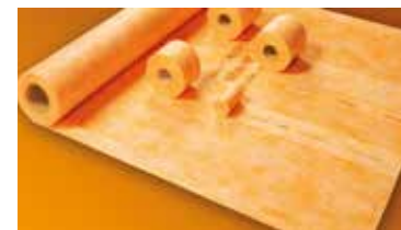
Schlüter®-KERDI pewne uszczelnienie w kilku roboczych krokach.