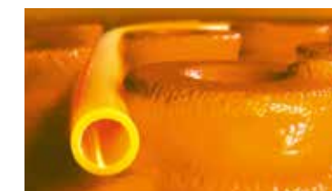
Schlüter®-BEKOTEC-THERM Ceramiczna posadzka klimatyzowana.