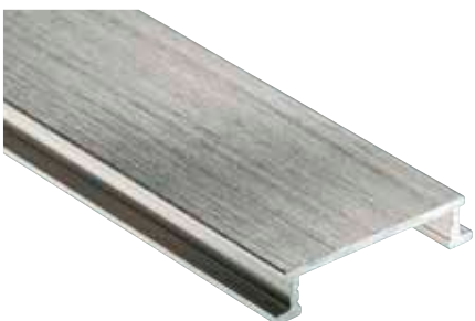
Schlüter®-DESIGNLINE-ATGB geborsteld geanodiseerd (-ATGB)

DESIGNLINE-E wordt vervaardigd uit stroken roestvast staal, V2A (materiaaltype 1.4301 = AISI 304). Roestvast staal is vooral geschikt voor toepassingen die bestand moeten zijn tegen zowel hoge mechanische belastingen als chemische inwerkingen, door bijv. zure of alkalische invloeden, reinigingsmiddelen. Ook roestvast staal is niet bestand tegen elke soort chemische aantasting, zoals zout- en vloeizuren of bepaalde chloor- en zout bronwaterconcentraties. Dit geldt in sommige gevallen ook voor zoutwater zwembaden. Te verwachten bijzondere belastingen moeten daarom vooraf worden gecontroleerd.