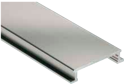
Schlüter®-DESIGNLINE-AME mat geanodiseerd (-AT)