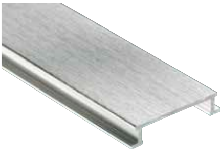
Schlüter®-DESIGNLINE-AGBE geborsteld geanodiseerd (-ACGB)