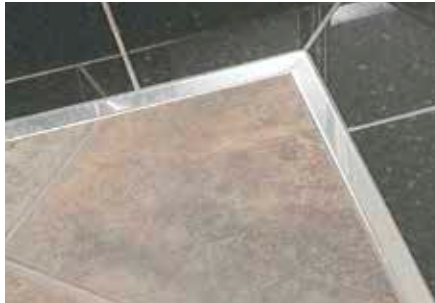
Schlüter®-DESIGNLINE-E op vloeren

Neem alle veiligheidsinstructies en voorschriften van de fabrikant van het snijgereedschap in acht, ook met betrekking tot het gebruik van een veiligheidsbril, gehoorbescherming en handschoenen. Ongeacht het gebruikte snijgereedschap moeten vóór de plaatsing alle bramen aan het uiteinde van het profiel met een vijl of gelijkaardig worden verwijderd.