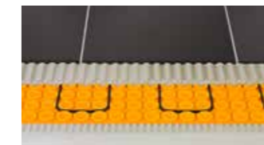
Schlüter®-DITRA-HEAT universele ondergrond voor tegelbekledingen, kan systeemconforme verwarmingskabel opnemen voor vloer- en wandverwarming