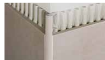
Schlüter®-RONDEC, -QUADEC, -JOLLY profielsystemen voor decoratieve wanden en voor de bescherming van uitwendige hoeken