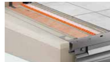
Schlüter®-balkonsystemen complete oplossing voor nieuwbouw en renovatie van balkons en terrassen

Wilt u meer weten over Schlüter-producten en -systeemoplossingen voor tegelbekledingen? Vraag dan naar één of meer van de volgende folders in onze verkooppunten. U kunt ook terecht op onze internet-site www.schlueter-systems.nl .