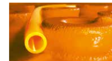
Schlüter®-BEKOTEC-THERM de klimaatregelende tegelvloer