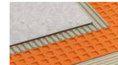
Schlüter®-DITRA 25 afdichtings- en ontkoppelingsmat voor tegelbekledingen op probleemondergronden (bv. hout, gips of een gebarsten ondergrond)