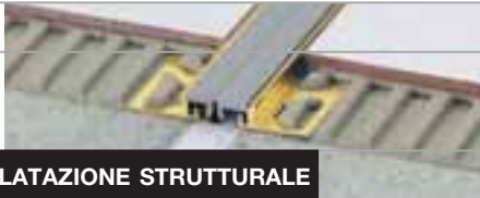
GIUNTO DI DILATAZIONE STRUTTURALE