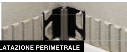
GIUNTO DI DILATAZIONE PERIMETRALE