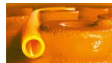
Schlüter®-BEKOTEC-THERM A kerámia klíma-padló