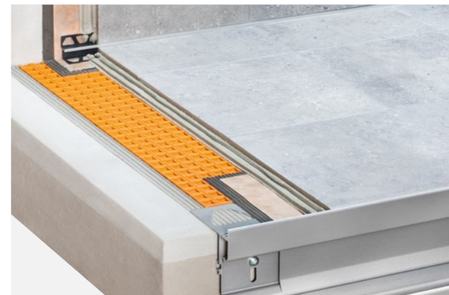
Structure de balcon avec protection à l'eau Schlüter-DITRA