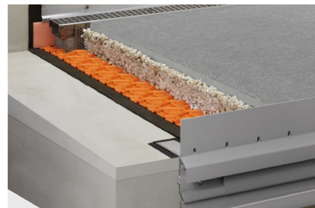
Structure de revêtement sur lit de gravier/de concassé avec Schlüter-TROBA