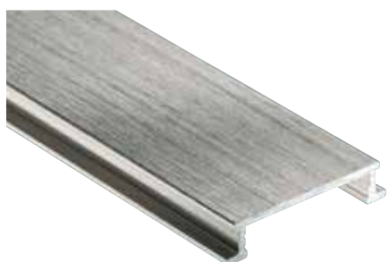
Schlüter®-DESIGNLINE-AGBE anodisé brossé (-ATGB)

DESIGNLINE-E est fabriqué à partir de bandes de tôle d'acier inoxydable V2A (alliage 1.4301 = AISI 304). L'acier inoxydable convient particulièrement pour des applications qui nécessitent non seulement une résistance mécanique élevée, mais aussi une bonne résistance aux produits chimiques tels que les acides, les alcalins et les produits de nettoyage. L'acier inoxydable ne résiste pas à tous les produits chimiques ; il est attaqué par des produits tels que l'acide chlorhydrique ou l'acide fluorhydrique ou par du chlore et des alcalins à partir d'une certaine concentration. Il peut également être attaqué par exemple par de l'eau saline ou de l'eau de mer. Il convient donc de définir au préalable les sollicitations prévisibles.