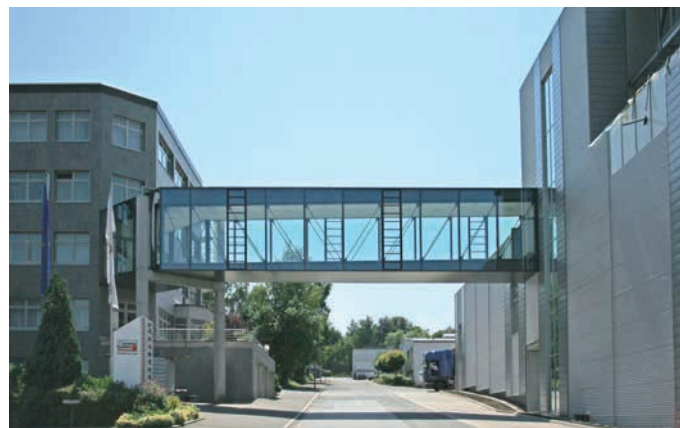
Projet pilote pour l'utilisation d'énergies renouvelables : le siège de la société Schlüter-Systems à Iserlohn.

Ainsi, nous utilisons depuis plus de 35 ans des matériaux recyclés pour la fabrication de nos produits – avec une proportion qui atteint actuellement plus de 50 % pour la fabrication des profilés en inox et jusqu'à 30 % pour les profilés en aluminium. Il va de soi que les déchets d'estampage lors de la production de pièces en plastique et en métal sont entièrement réutilisés.