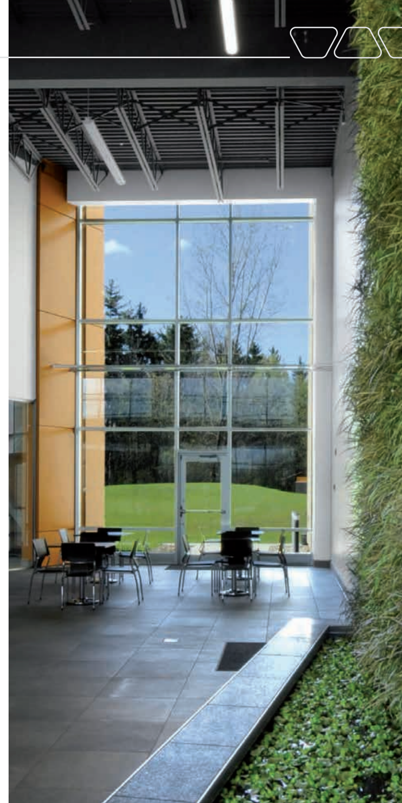
Certification LEED « Or » : la succursale Schlüter-Systems à Montréal, Canada.

Le siège de la société, à Iserlohn, est quant à lui chauffé par activation du noyau en béton, et par le système de plancher chauffant-rafraîchissant Schlüter®-BEKOTEC-THERM, alimenté par géothermie.