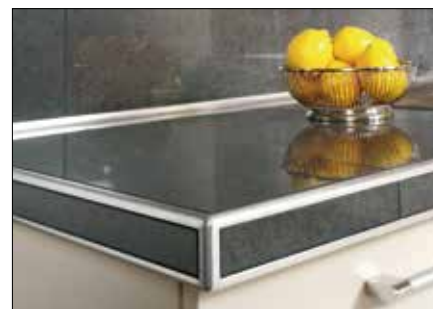
pour des plans de travail de cuisine