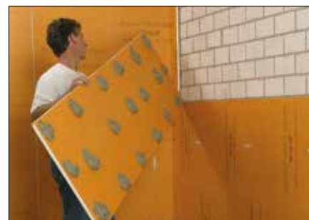
sur de la maçonnerie brute ou des supports mixtes