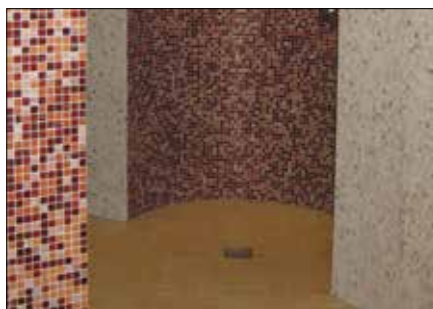
pour des surfaces murales courbes, colonnes et éléments galbés