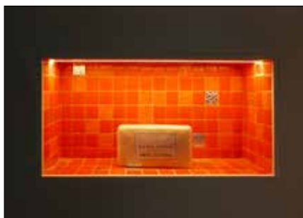
pour des niches et des surfaces de rangement dans les zones humides