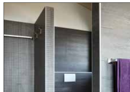
pour des cloisons de séparation