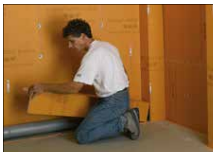
pour masquer des canalisations