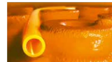
Schlüter®-BEKOTEC-THERM El pavimento de cerámica climatizado.