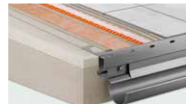
Schlüter®-Sistemas para balcones solución completa para la construcción y el saneamiento de balcones y terrazas.