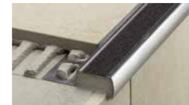
Schlüter®-TREP Perfiles antideslizantes para escaleras.