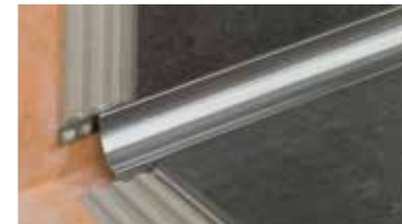
Schlüter®-DILEX Sistema de perfiles para la creación de juntas de movimiento y con protección de los cantos.

¿Desea saber más sobre otros productos y soluciones de sistema Schlüter para la colocación de baldosas? Nuestros distribuidores disponen de los siguientes folletos explicativos. Asimismo encontrará más información en nuestra página en Internet www.schluter.es .