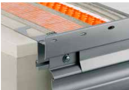
Aufbau mit Schlüter-DITRA-DRAIN 8 und Schlüter-BARA-RTKE 23