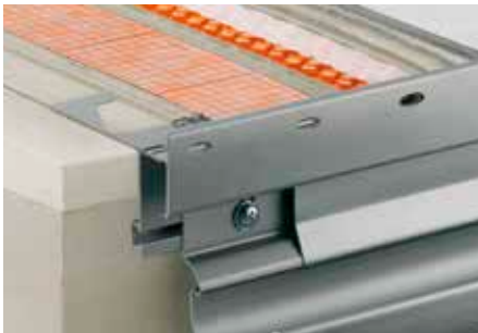
Aufbau mit Schlüter-DITRA-DRAIN 4 und Schlüter-BARA-RTKE