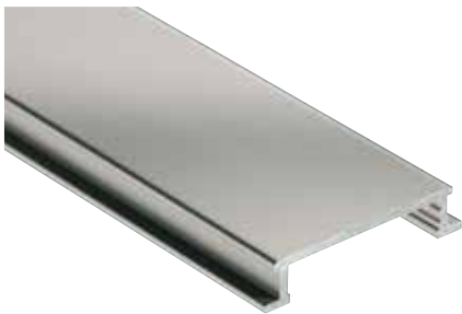
Schlüter®-DESIGNLINE-AME matt eloxiert (-AT)