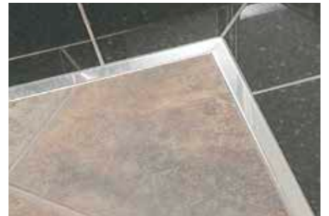
Schlüter®-DESIGNLINE-E im Bodenbereich