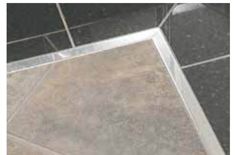
Schlüter®-DESIGNLINE-E im Bodenbereich