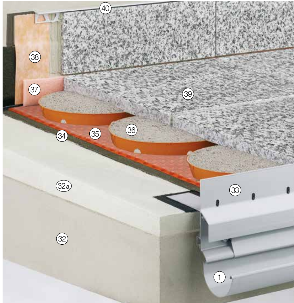
Weitere mögliche Anschlussprofile siehe „Konstruktionsaufbauten A: Frei auskragende Balkone“