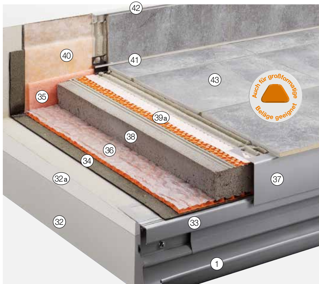
Weitere mögliche Anschlussprofile siehe „Konstruktionsaufbauten A: Frei auskragende Balkone“

Lieferbar in zahlreichen unterschiedlichen Farben und Oberflächen. Material: Edelstahl oder Aluminium farbig beschichtet