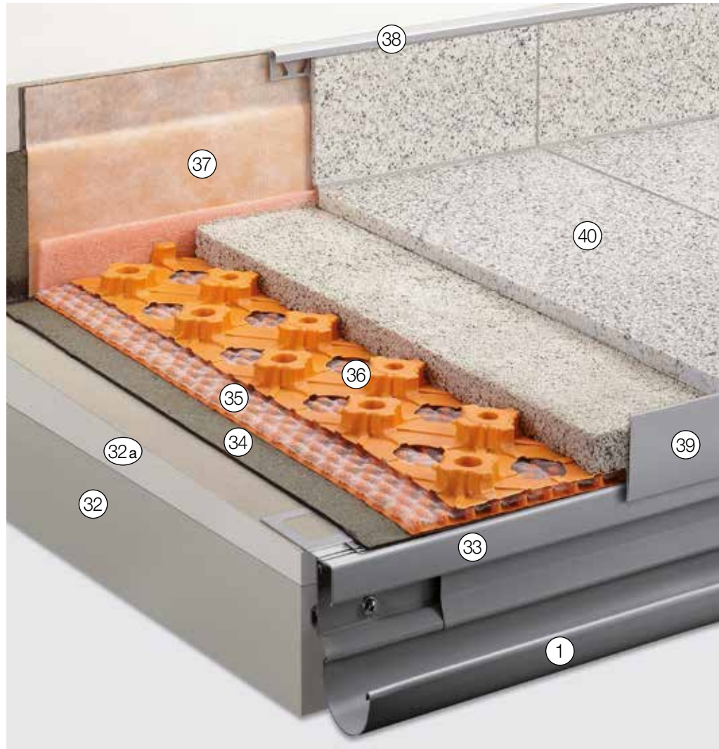
Weitere mögliche Anschlussprofile siehe „Konstruktionsaufbauten A: Frei auskragende Balkone“