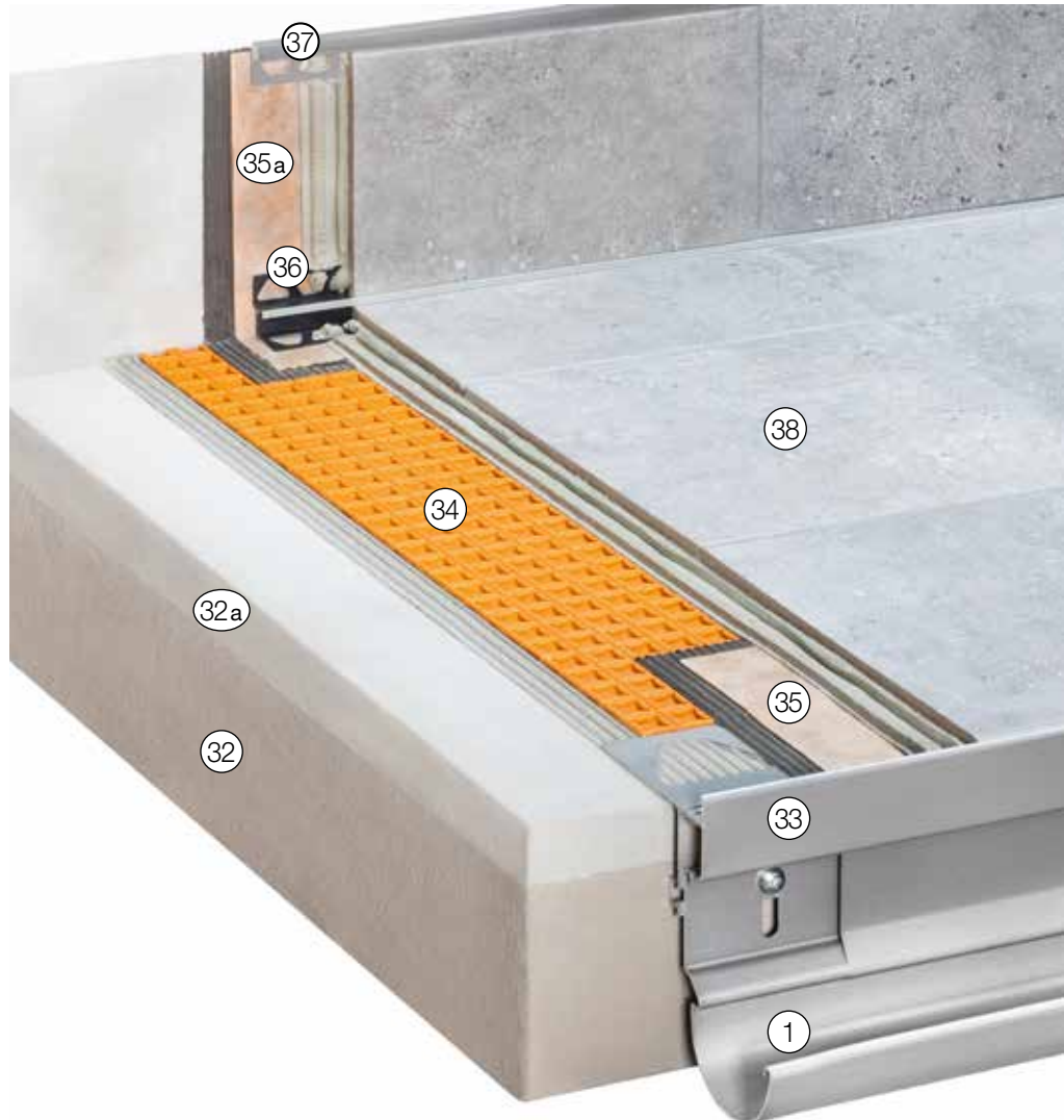
Weitere mögliche Anschlussprofile siehe „Konstruktionsaufbauten A: Frei ausragende Balkone“