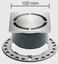
Designbeispiel / Design sample