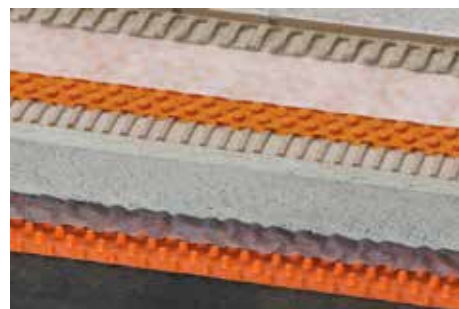
Schlüter-TROBA-PLUS 8 (12)

U volné pokládky na lože ze štěrku / kamenné drti nebo na podložky může při jednostranném nebo rohovém zatížení docházet k pohybům deskových materiálů. U konstrukcí s ložem ze štěrku nebo kamenné drti < 5 cm může vznikat lehký pružící efekt. Aby se mu zabránilo, doporučujeme pokládku na Schlüter-TROBA, viz technický list výrobku 7.1.