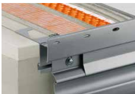
Skladba se Schlüter®-DITRA-DRAIN 8 a Schlüter®-BARA-RTKE