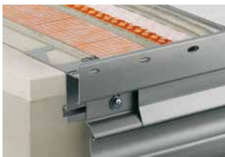
Skladba se Schlüter®-DITRA-DRAIN 4 a Schlüter®-BARA-RTKE