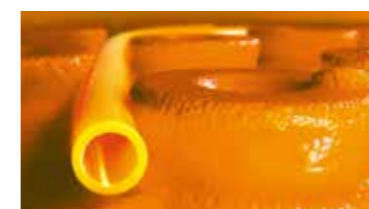
Schlüter®-BEKOTEC-THERM Keramická klima podlaha