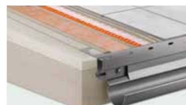
Schlüter®-balkonový systém Kompletní řešení pro novostavbu a rekonstrukce balkonů a teras