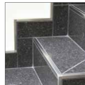
Schodová hrana a ukončení soklu

Schlüter-QUADEC je ukončovací profil pro vnější hrany obkladů a soklů. Různé materiály, barvy a povrchy umožňují barevné sladění vnějších hran obkladů, obkládaček a spár nebo vytvoření zajímavých kontrastů. Profily zároveň chrání hrany před poškozením. Profily z ušlechtilé oceli lze použít i pro ukončení podlahy nebo na hranu schodů. Stejně tak je možné vytvořit ukončení hrany nebo zakrytí soklů z jiných materiálů jako např. koberců nebo parket.