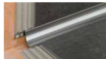
Schlüter®-DILEX Systém profilů pro trvale bezúdržbové dilatační a okrajové spáry

Chcete se dozvědět více o dalších Schlüter-Systems výrobcích a systémových řešeních pro pokládání dlažby a obkladů? U našich distribučních partnerů lze získat následující brožurky. Další informace nabízí naše internetová stránka www.schlueter.cz .