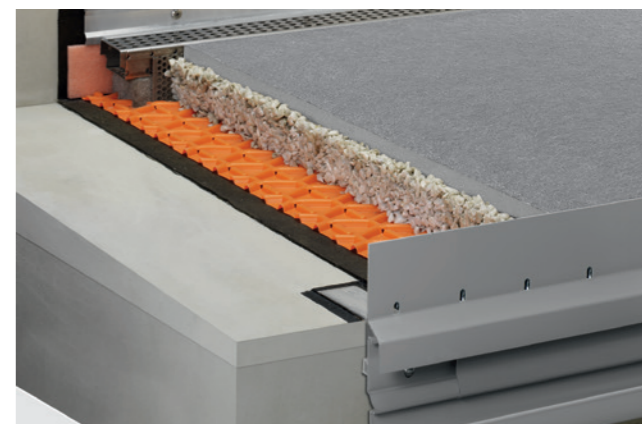
Podlahová konstrukce do lože ze štěrku / kamenné drti se Schlüter-TROBA