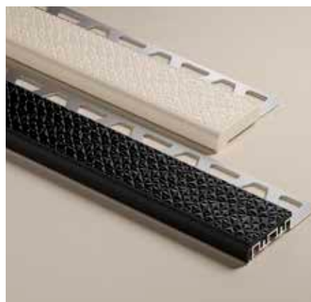
Combinación de color GS con SP (en este caso TREP-V 42/12)