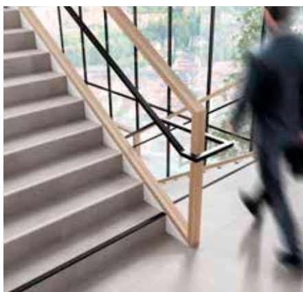
Ejemplo de aplicación