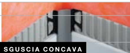
PROFILO A SGUSCIA CONCAVA

PER ANGOLI INTERNI NEI RIVESTIMENTI CERAMICI