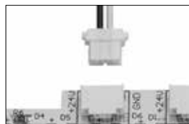
Câble en boucle