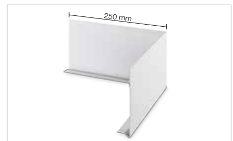
Ángulo externo: Schlüter-BARA-FAP/E 90°

Nota: como unión se recomienda utilizar la cinta de solape Schlüter-BARA-STU