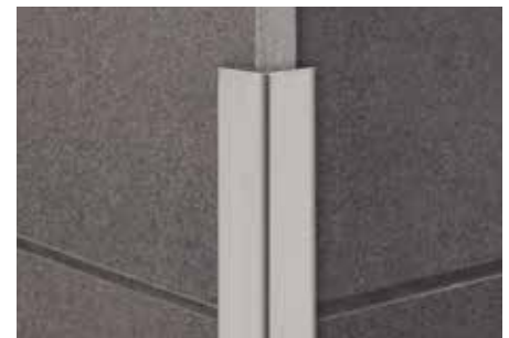
Schlüter-ECK-K 15 EB

Der Kontakt mit anderen Metallen wie z.B. normalem Stahl ist zu vermeiden, da dies zu Fremdrost führen kann. Dies gilt auch für Werkzeuge wie Spachtel oder Stahlwolle, um z.B. Mörtelrückstände zu entfernen. Im Bedarfsfall empfehlen wir die Verwendung der Edelstahl-Reinigungspolitur Schlüter-CLEAN-CP.